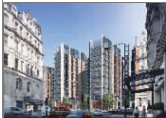
临近英国著名百货公司:哈罗德百货大楼