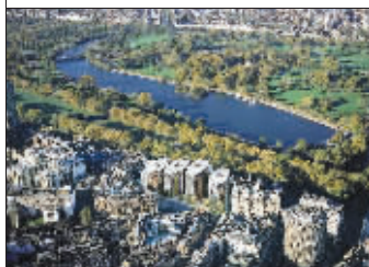
这所豪宅所在的骑士桥区是一个著名的富豪聚居区