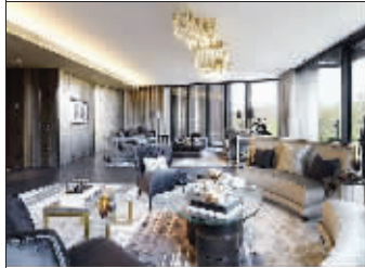
豪宅内部装潢极其奢华