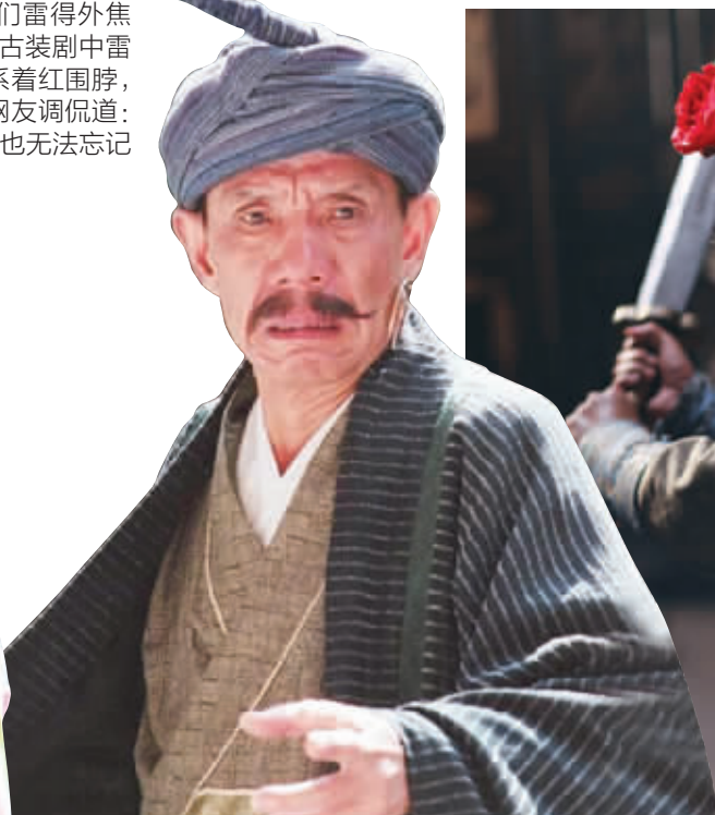
大叔头上这鱼竿,刚钓鱼回来呢?