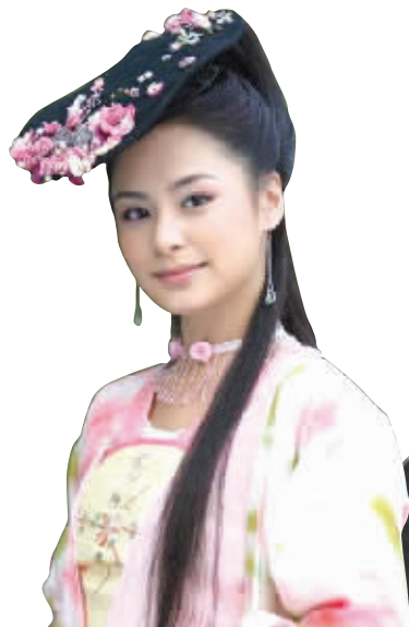
看看这头顶上的鞋垫,挺花哨。

电视剧中人的造型经常将网友们雷得外焦里嫩。近日,有网友在百度贴吧细数古装剧中雷人造型,他们有的头顶钓鱼竿,有的系着红围脖,还有的穿着西洋婚纱玩穿越……有网友调侃道:“只因在剧中多看了你一眼,我就再也无法忘记你容颜。”