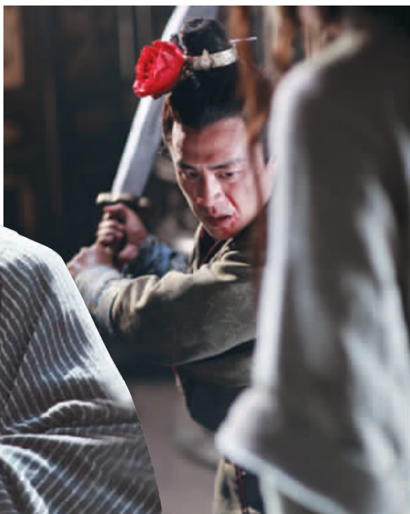
西门大官人这头花真鲜艳!