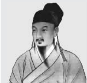
孙思邈，京兆东原人(今陕西省耀县孙家塬人)，出生于隋开皇元年，卒于唐永淳元年。终年102岁，是古今医德医术堪称一流的名家，他是我国乃至世界历史上著名的医学家和药物学家。历史上，被人们尊称为“药王”。

“生命态散结灵”，源自孙思邈经典古方“散结汤”演变而来，距今已有1300多年历史。该方依据孙思邈“阴疽之治”之理论，根据囊肿、肿块、肌瘤、息肉发病原因，临床表现，在原配方的基础上科学加减配伍，集散结消肿、活血破瘀于一体，着力在散结除囊上下功夫。被历代名医誉为散结消肿第一方。药材全部来自秦岭深处无人区纯天然野生“草”经现代中药膜分离技术、保持了原“生物草”独有的活性成份“散结素”。能迅速扼杀病变细胞、切断血氧供应、修复毛细血管及神经。