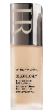
HR赫莲娜 轻透自然立体粉底液 SPF 20 PA+++ RMB780/30ml