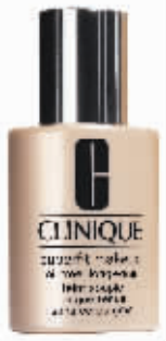
Clinique倩碧舒爽透气粉底 RMB 310/30ml