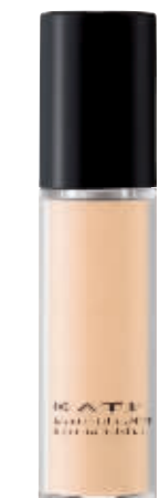
KATE 遮瑕防晒持久美肌粉底液 RMB159/30ml