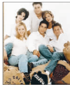
电视剧《老友记》海报

非常快,充斥着辩论和演讲,词汇也非常高级,听起来很有难度。如果能把这部剧都学习透,英语方面估计就没什么难关了。”