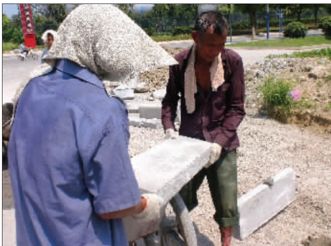
天这么热,他们依然在工地干活