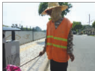
辛苦,环卫工在清理垃圾