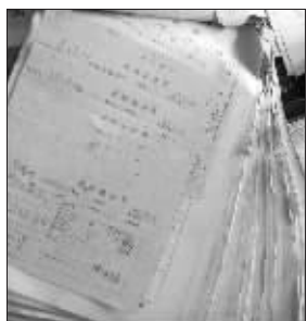
厚厚一摞病历本