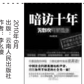
2010年4月 作者:李么俊 出版:云南人民出版社

本书作者曾从事过公务员、记者等职，现供职于南方某报业集团，为知名暗访记者。这虽然是一部小说，却有作者的经历糅于其中。小说揭示了乞丐群落、妓女、血奴、酒托等隐秘社会群落的生活，深刻揭示了中国底层社会问题。