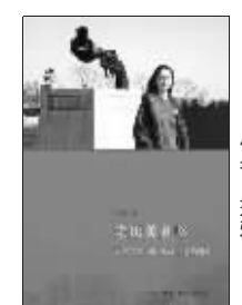
2010年7月 作者:王雅 出版:三联书店

作者到美国学政治学。因为要租房子，她接触了美国的家庭；因为做“babysister”，她了解了美国的孩子和他们的家教；因为读书，她领教了美国的校园政治；因为是学政治学的，她注意观察美国总统……她站在中国人的角度去观察美国，感受美国。