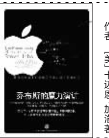
2010年7月 作者:史蒂夫·乔布斯 出版:中信出版社