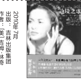
2010年7月 作者:美西·吉姆林奇 出版:吉林出版集团