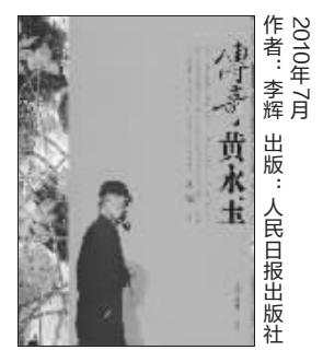
2010年7月 作者:李辉 出版:人民日报出版社

坊间有关黄永玉的称谓很多，像“湘西老刁民”“湘西蛮子”“一代鬼才”“浪荡狂人”等等——不管黄永玉本人是否认可，这些称谓却无不形象地描画出黄先生平生无拘无束、特立独行的传奇色彩。作家李辉的新著《传奇黄永玉》，即在采访了许多当事人与阅读了大量第一手文献史料的基础上，以诸多生动、真实的细节和数百幅历史图像，还原了一个时代的历史场景，再现了一位艺术大师起大落、跌宕起伏的传奇人生。