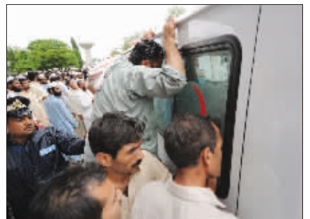
人们向救护车车内张望