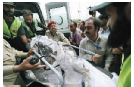
运送遗体