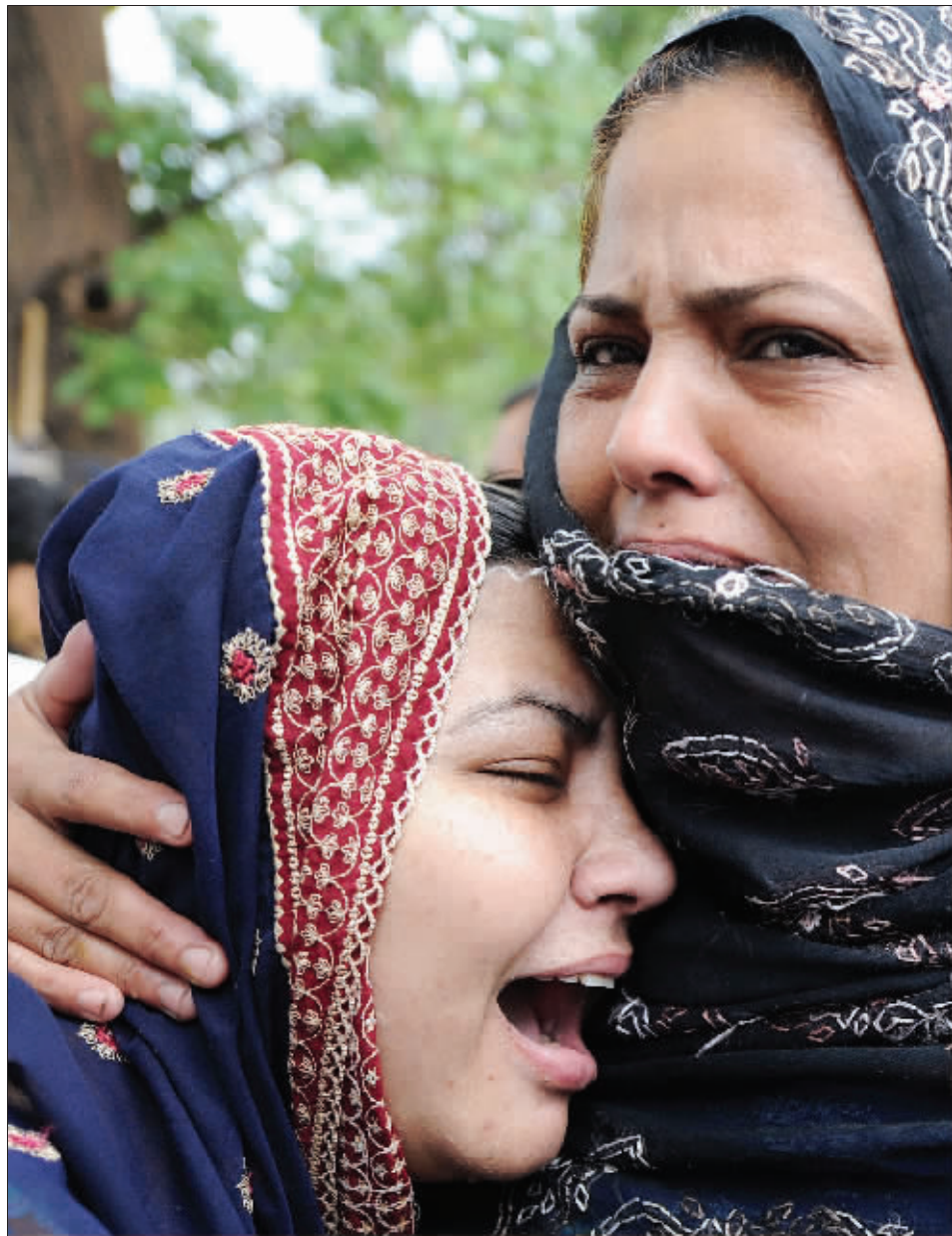
悲痛的机上乘客亲属

造成此次空难的原因还没有彻底查明,但机场方面的一名发言人表示,他们怀疑与恶劣天气有关。出事飞机为一架私人飞机,隶属于巴基斯坦蓝色航空公司,巴基斯坦总理吉拉尼已命令国防部展开调查。巴政府宣布29日为哀悼日,悼念这次空难的遇难者。 综合