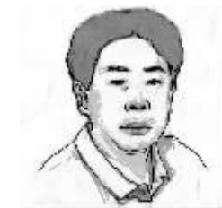
(作者系资深时事评论员)

昨日“西部网”的一条消息乍一看颇让人眼前一亮。该消息的赞扬对象是陕西志丹县,该县借助县级大局制试点,欲将政府机构压缩1/5,公务员总数由800名降至600名,县政府不再设县长助理,也不再设秘书长和副秘书长