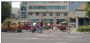
在锡山区食品安全检测中心门口揽客的黑车