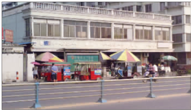
在公交站台揽客的三轮车