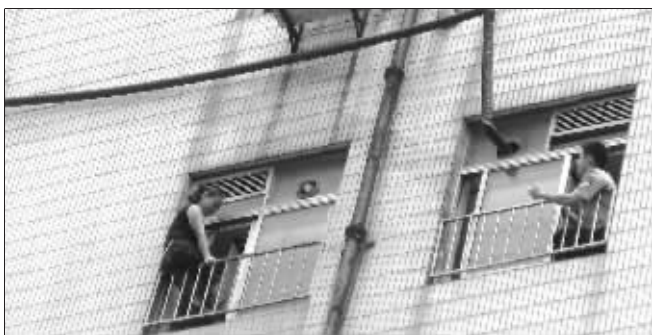
跳楼女子僵持6个多小时后被救下

“怎么这么想不开啊?”“好像是夫妻吵架。”据了解,该大厦6楼为某公司办公写字楼,女子的丈夫是该公司的临时工程师,当天正好外出出差。女子怀疑丈夫搞外遇,而两人在沟通上出现