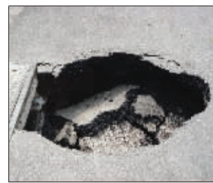
▲这个洞紧挨着污水管道的井盖 ◀洞口周围已经安置了围挡