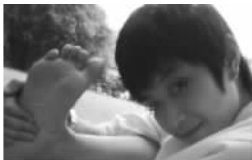
个月就长出了新甲,现在工作非常努力,在企业里领导也很重视他,我非常感谢康甲100把我10年的痛苦都解决了,让孩子有了更好的发展。

一次偶然的机会看到了康甲100的介绍,说是由美国加州期间生物实验室研制,只需轻轻一涂,瞬间成膜,2分钟后即可洗手,洗脚,无需包扎,脱甲也不痛,太简单方便了,于是我就买了4盒,用了后,果然是那么简单,一个月后我的手指和脚趾都长成了新甲,现在都快2年了也没有见灰指甲再长出来,这次我真的与灰指甲告别了。孩子用了一