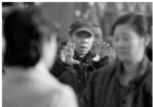
冯小刚给演员说戏

电影《唐山大地震》的票房持续飙升，上映五天破了两亿票房。然而，该片导演冯小刚近日接受《凤凰网·非常道》节目专访时却透露，在影片筹备之初，他曾几次想放弃。