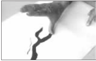
白鹤亮翅:画粗线或点、抹,拇指作用颇大,犹如白鹤亮翅。