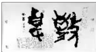
这是陆华用手指写的“敬事”(从右至左)二字

潘天寿生前谈论指画,“运指作线,欲粗欲细,欲浓欲淡,远不如使用毛笔为方便,这是大缺点,也是大优点,正因为不方便,不流畅,断断续续,粗粗细细,湿处极湿,干处极干,造成一种独特的凝重古朴之感,显得比笔画更刚、更辣、更涩,也更见骨。”