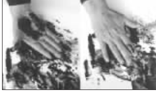
翻云覆雨:手掌、手指都能发挥作用,特别是在画大画时,痛快淋漓。