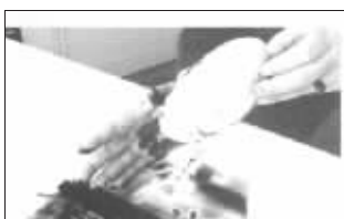
翻江倒海:通常叫作泼墨或泼彩。涂料倾盆而下,连涂带抹。张大千、刘海粟常用此法。