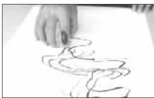
神龙行云:五指齐下,所出线条如行云流水。