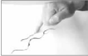
春蚕吐丝:画细线,用小指。极细需要较长指甲,如春蚕吐丝。