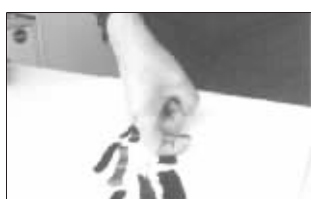
倒挂金钩:画整齐而较粗的线条,如竹杆,用指节为宜。