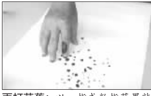
雨打芭蕉:以一指或数指蘸墨敲点,痛快利落,如雨打芭蕉。