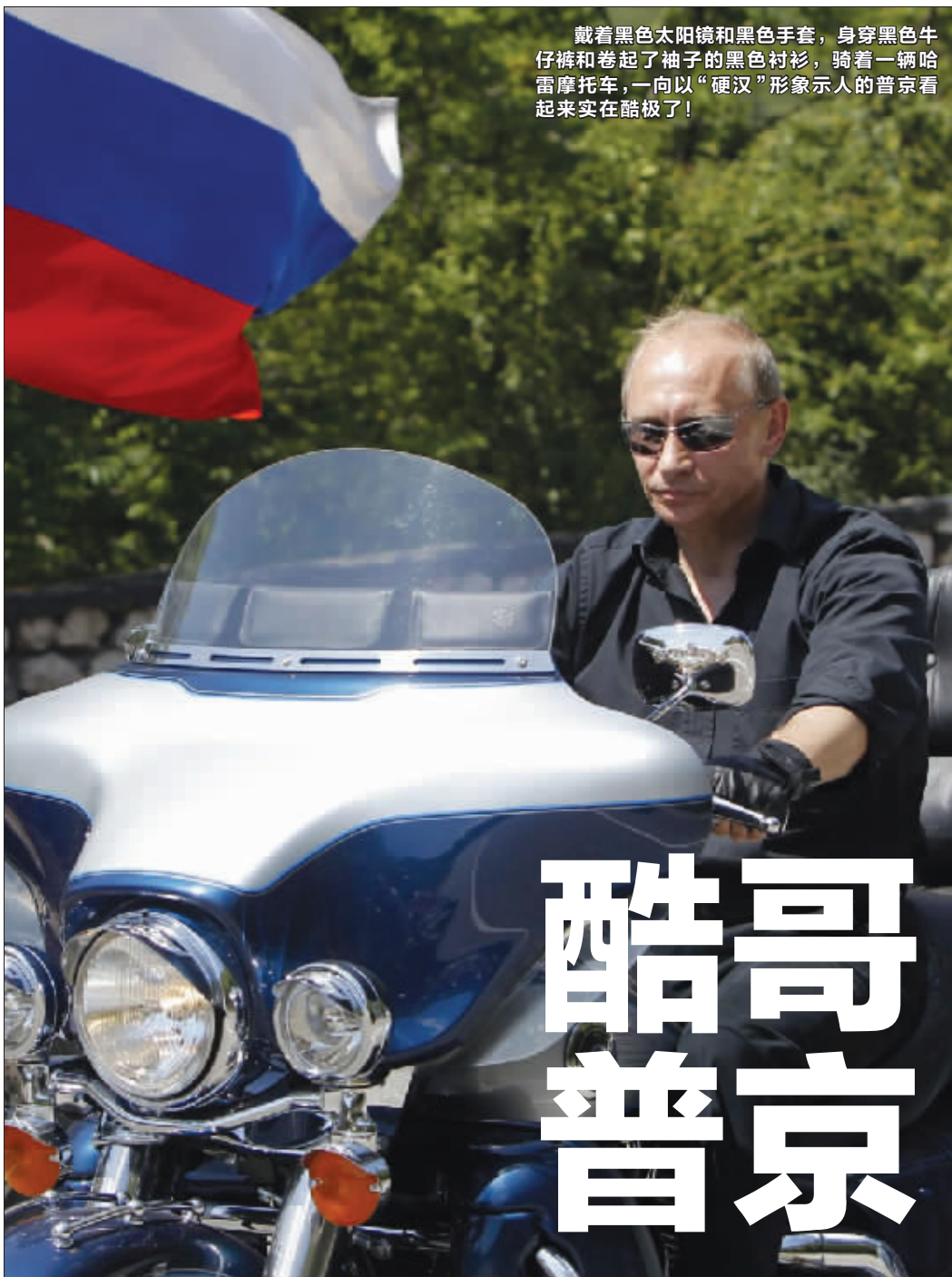
戴着黑色太阳镜和黑色手套,身穿黑色牛仔 裤和卷起了袖子的黑色衬衫,骑着一辆哈 雷摩托车,一向以“硬汉”形象示人的普京看 起来实在酷极了!