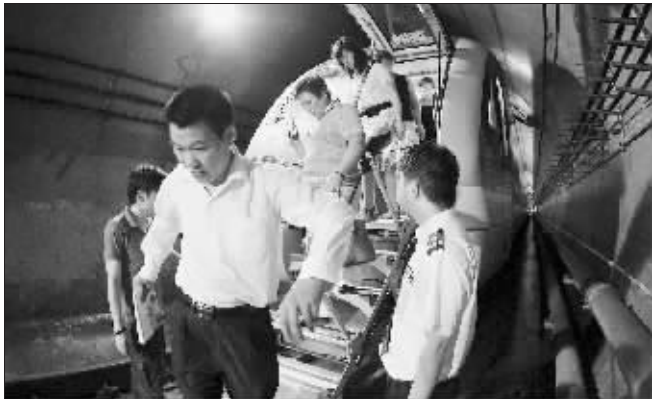
市民在小行地铁基地体验隧道逃生

地铁内突然着火、出现匪徒、有人打架……相信很多市民乘坐地铁时碰到这些意外都会手足无措,其实地铁车厢里藏着很多这样那样的“机关”:红色按钮一按,就可直接和司机通话;“一”字形的自动解锁装置只要顺时针扳列车门就会打开,列车车头车尾均有逃生门等。昨天,地铁邀请了100名乘客参与了安全宣传活动,结合一些案例告知紧急情况下怎么处理。南京地铁运营公司副总何志康表示,今后每年都会举行一次这样的活动。