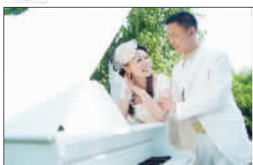
1148阁昕好爸爸妈妈婚纱照