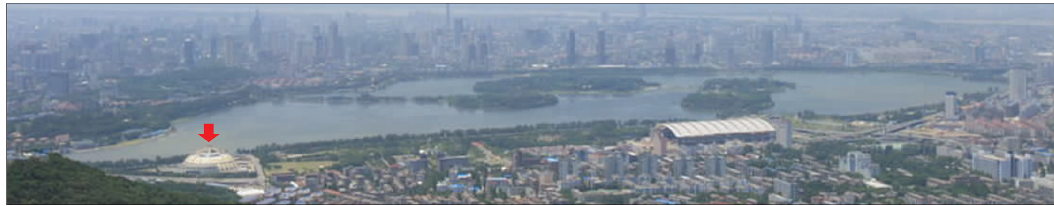
玄武湖全景(箭头所指为江苏大剧院选址) 资料图片