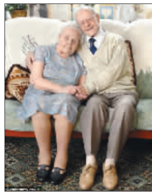
现在的塔兰特夫妇

如果你喜欢高智商的人,你就会爱上这儿。这里是一个位于硅谷中心的高科技圣地,当然也“盛产”高科技达人,聪明的男人可以说到处都是。这里也有很多体育活动项目,你可以到国际游泳中心等场所来和运动员共同游泳。也许顺便就能找到你梦中的另一半。