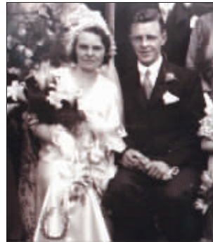
结婚时的塔兰特夫妇