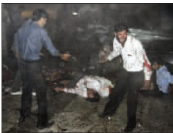
爆炸现场