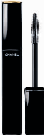
香奈儿炫长卷 翘防晕染睫毛 膏 RMB300