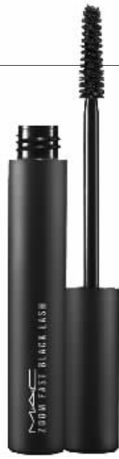
M.A.C 魅可 焦点所致浓 黑纤长睫毛 膏 新品上市

一对浓密纤长的睫毛加上魅力闪烁的大眼,绝对是现代美女必备的条件!为了打造魅力电眼,一支兼具纤长、浓密卷翘、同时又可长时间不晕染的梦幻睫毛膏,就成为MM们释放魅力的必备武器了!为了让简单的刷睫毛步骤,也能展现出宛如戴上假睫毛、透过睫毛一般的迷人妆效,各家化妆品品牌无不铆足了劲儿研发新产品,各有各的秘诀值得消费者推敲,也许助你变身为大眼美女的神奇魔法,就在以下这小小一支睫毛膏之中呢!