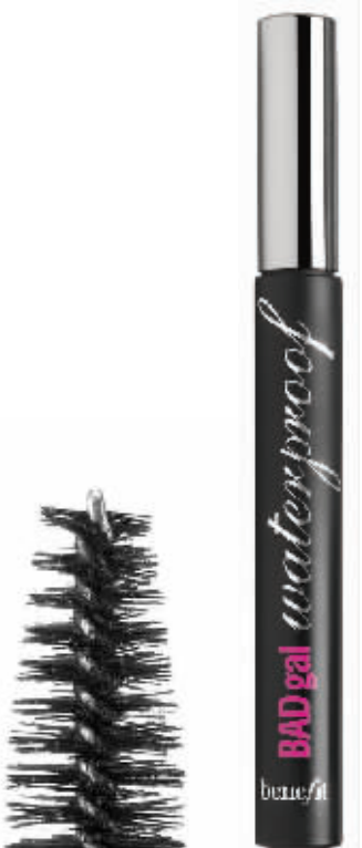
坏女孩防水 睫毛液 RMB 200