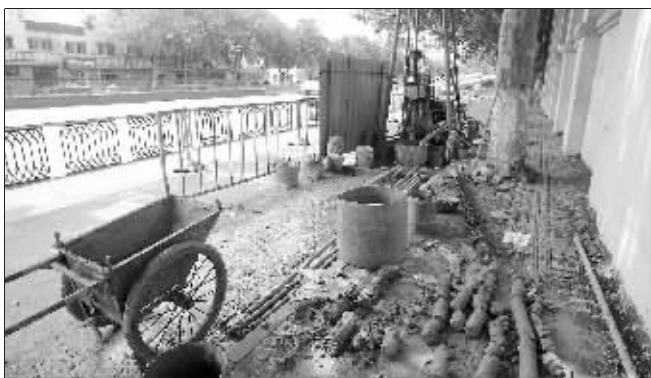
草场门立交桥南口的勘探工地已经施工多日

的地质勘测,但这是个很特殊的地段,“城西干道高架改隧道工程全长接近7公里,其中草场门隧道是其中十分重要的一段,草场门隧道全长770米,将要与地铁四号线地下相交。地铁四号线江南段即将启动建设,因此这个地方提前进行地质勘测。”