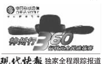
现代快报 独家全程跟踪报道

主办方称,下一场江苏移动“神州行360行状元选拔赛”将在本周六、周日移师泰州和徐州两地。“小岗位大才能”,比赛持续进行,精彩好戏连台。报名可拨打12580转8或登录江苏移动网站神州行专区,更多详情请咨询10086,5000元状元大奖等待你的参与。徐勇