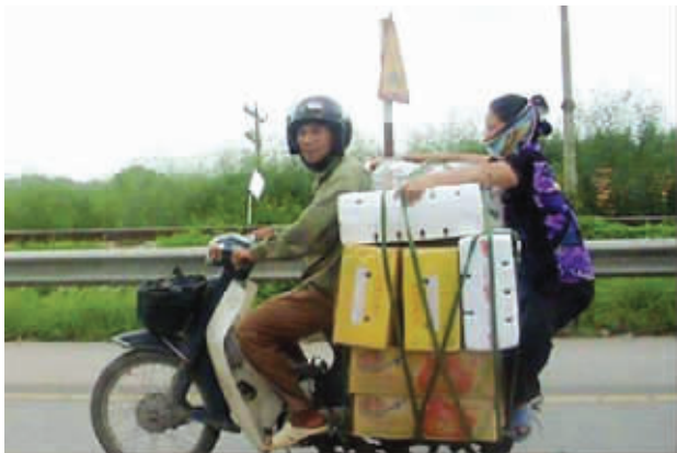
不要迷恋姐,姐以前是杂技团的

果没有光的时候呢?”“绝对不亮!” 对待达文西这样的天才,我们只能说:你赢了。 欣赏本组图片的同时,回味一下经典对白吧。“我希望你叫我全名——达文西。”“没问题,文西。”“谢了。”“不客气,文西。”