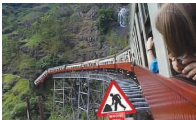
杯具,前方施工,司机走错了路

最近老是有人抱怨,现在的微博形成了一个这样的风气,不管发什么文字,都得配上一张图,不然都没人看。这也好解释,图片的笑点比文字形象很多,有一种一切都在不言中的感觉。加上网友随时随地都能用相机、手机抓拍搞笑街景,现在已经到了全民读图时代了。