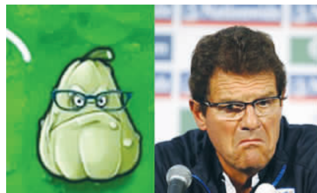
原来卡佩罗是个南瓜,满脑子糊涂玩意