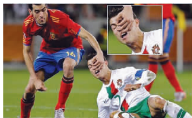
C罗:不要捏我的鼻孔,我还要靠脸吃饭