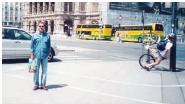
右边的哥们,我好好地拍个照,你干吗抢镜