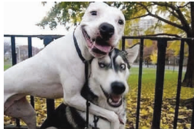
不好,暴露了,有人偷拍

小白兔大叫:你要是再敢用胡萝卜当鱼饵,我就扁死你! 以兔子为首的一群小动物们,不仅在文字上天天被我们恶搞,而且连图片也不放过,太惨了,太搞笑了。