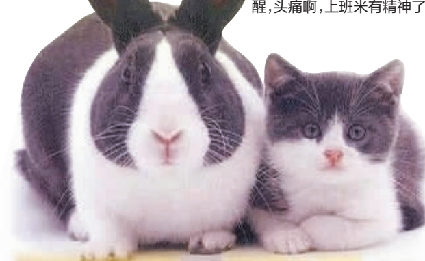
我们是真心相爱的,你看多有夫妻相