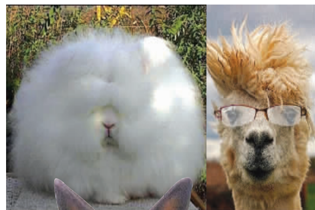
每天早上老被自己帅醒,头痛啊,上班米有精神了