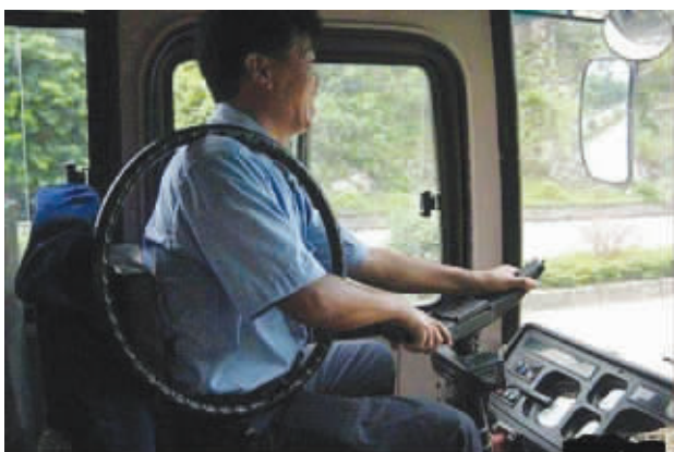
其实我是哪吒,所以我神通广大