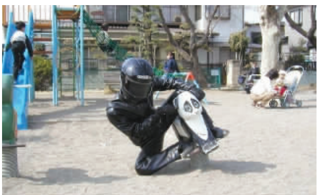
哥正在弯道超越,超帅吧