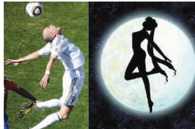
月亮月亮!我要变身!

又捶又打,以示庆祝,没想到竟把他打晕在地,抬了出去,结果乌拉圭以2:4输掉了这场比赛。 这不是笑话,这是真实的。就像这组图片中的笑点一样,都是真实的,笑死人了。