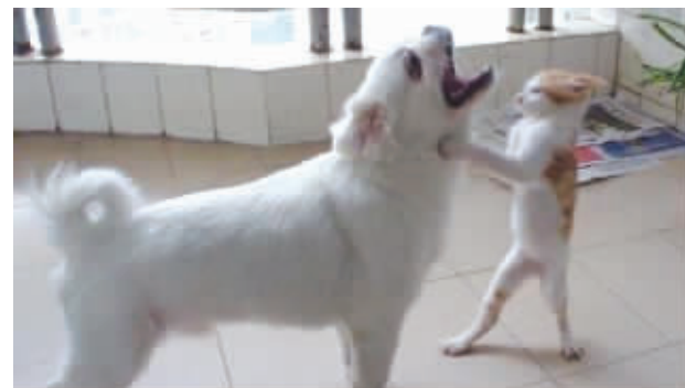
现在猫真是越来越强悍了,根本不把旺财放在眼里