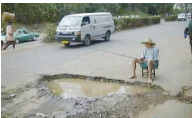
只要心中有鱼,在哪都能垂钓