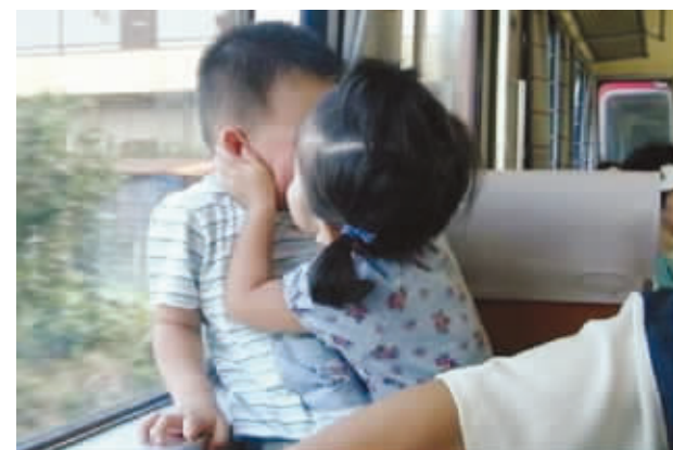
00后的告白方式——强吻