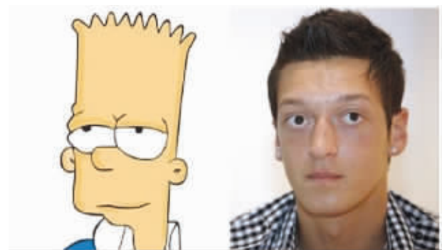
我说厄齐尔这么眼熟,眼睛太像了