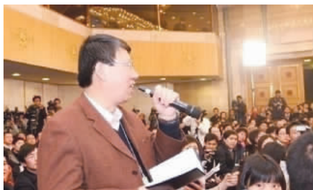
其实哥声如洪钟,话筒拿反照样提问