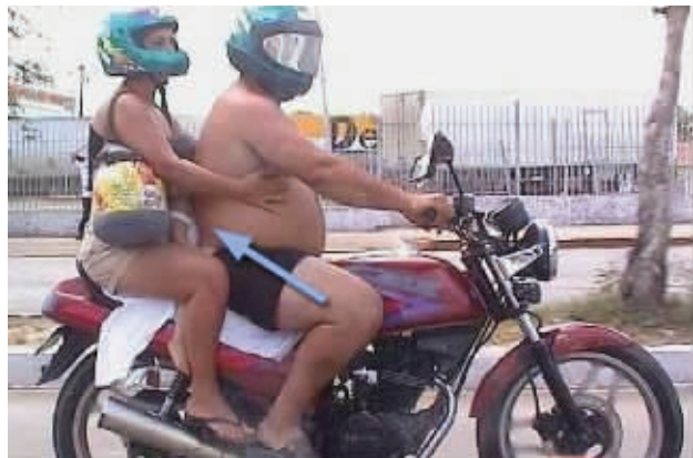
胖子什么的,最讨厌了

文也不行武也不行,你不做山贼,你想做状元啊?”“我有想过……”“省省吧!改变什么形象,好好地做你山贼这份很有前途的职业去吧!”后来至尊宝把毛笔头装成胡子,就更加的失败了。 看了这些图片,相信你对失败这个词的意思,会理解得更加深刻。