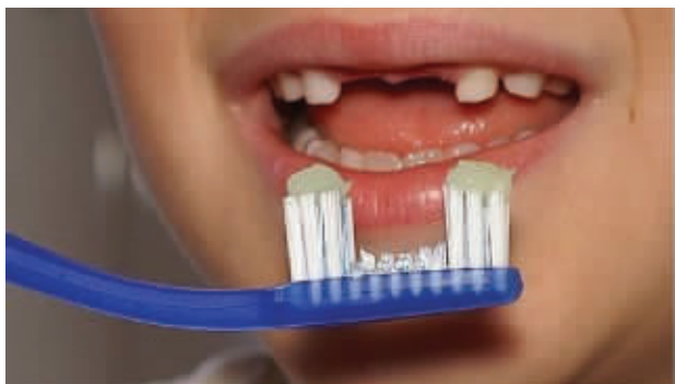
该牙刷专为无门牙人士设计