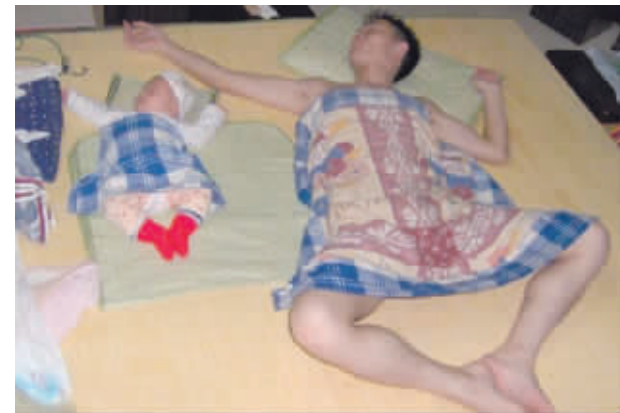
这爷俩不愧是父子,睡觉姿势一个德行

小朋友写:一只娃娃就要一百块。 题目:陆陆续续小朋友写:下班了,爸爸陆陆续续回来。 题目:欣欣向荣小朋友写:欣欣向荣荣告白。看图片吧,现在的小朋友,告白都是这么直接的。