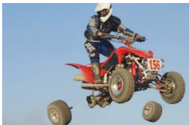
奸商啊,卖给我的什么车,哥杯具了