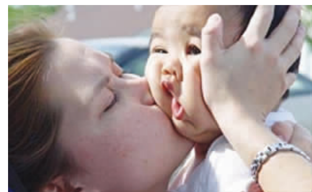
妈妈,轻一点,我觉得我的脸扭曲了