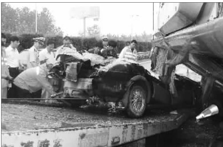
桑塔纳被大巴压成“饼干”