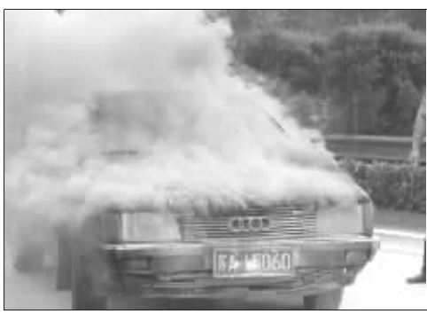
堵车时,后面一辆奥迪自燃,大火很快被扑灭