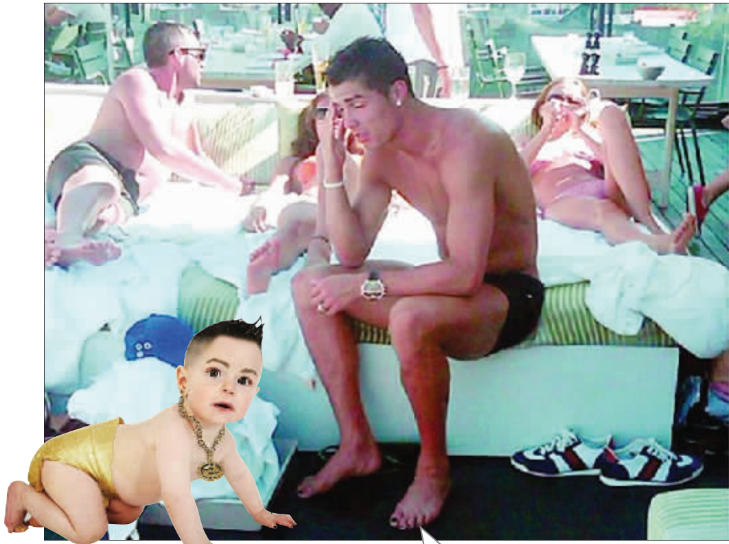
狗仔偷拍到C罗度假时的照片

葡萄牙被西班牙淘汰出世界杯后，C罗终日与女友伊莉娜·莎伊克泡在一起，试图放松身心，忘却创伤。但私生子风波让这位当今足坛身价最高的球星无法平静。《每日星报》日前爆料，为C罗代孕的女子是一位漂亮的美国妓女，更有媒体披露C罗度假期间染脚指甲的照片，再次质疑C罗的性取向。