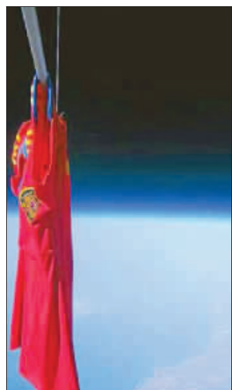
比利时的球衣被送上太空

自从出道以来，这个葡萄牙球星一直以自己大胆超前的时尚行为让人们大跌眼镜，他打耳洞带钻石耳钉，热衷于剃胸毛，而且常常以内裤出镜。这一次，更是到了登峰造极的地步。由于他寻找代孕母亲为自己生子的消息同时传来，连这名球星的性取向一时间都成了让人生疑的问题。有媒体怪罪C罗的家人，由于成长在一个女性成员为主要的家庭里，他的不少举止爱好都带有明显的女性情结。 宗禾