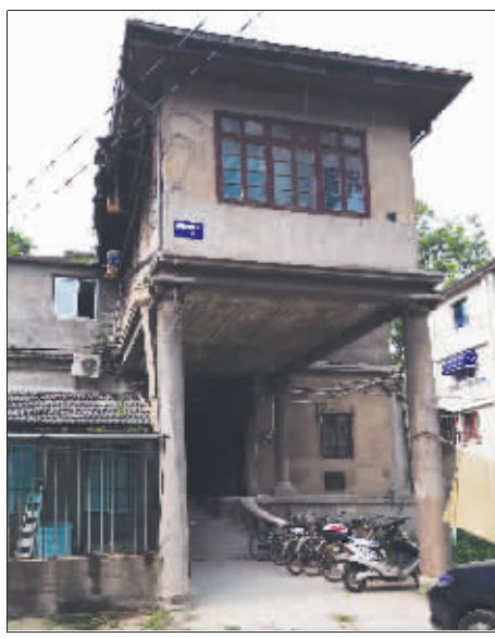
檐前的对称性立柱支撑着第二层突出的部分