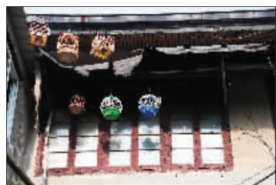
屋檐下悬挂着各色鸟笼