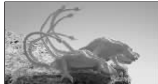
类地行星上的肉食动物

霍金相信,即使在平均温度到达液氮(比零下150℃还低)水平的星球上也有可能存活生命体。生物要在这种极寒星球上生存,它们的有机器官和生理构造必然与类地星球上的以水为生命线的生物截然不同。从理论上讲,如果极寒星球上的生物能获得支持生物活性的能量,即使在这种极低的气温下,仍有可能存活生命体。霍金想象中的耐寒生物不仅拥有许多只脚,它们的全身还长满厚毛以抵御强风和严寒。