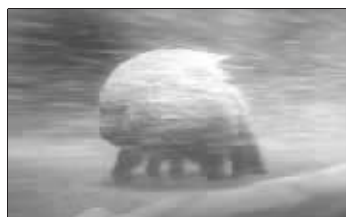
极寒星球上的生物

如果真的外星生物,它们会是什么样子?据美国媒体10日报道,《国家地理杂志》将根据著名英国物理学家史蒂芬·霍金的推论,用电脑动画的形式揭示人类“外星邻居”的生存状态。这是霍金继提出“人类千万不要和外星生物接触”的警告后,首次向世人展示他想象中的外太空生物的具体形态,他设想外星生物存活在四种地球上,不同的环境孕育出不同形态的生命。