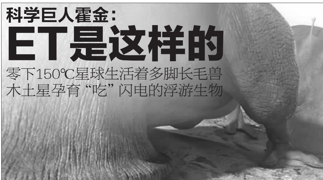
遥远类地行星上的草食动物