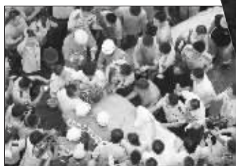
营救成功后,现场人员欢呼