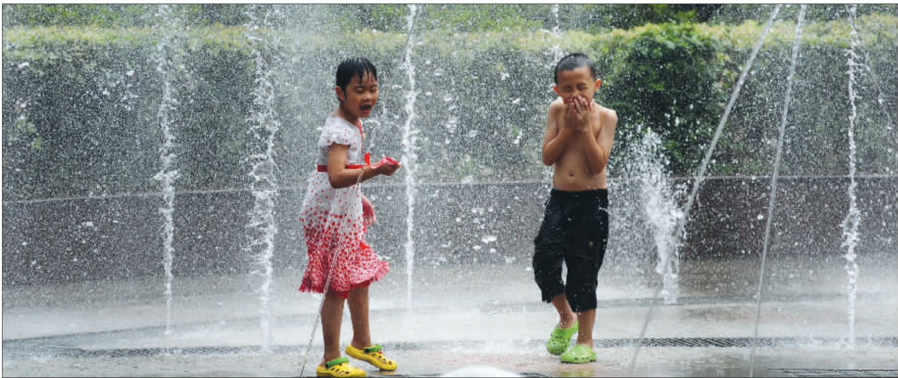
昨天,在南京新街口一喷泉处,两名孩子正在戏水。近日,南京城酷热难耐,许多市民以各种方式消暑纳凉