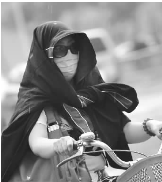
南京街头,市民以各自不同的方式遮挡阳光

我国一南一北都受到阳光的炙烤,根据天气资料分析,未来几天,江苏的天气将出现“先高温后大雨”的变脸。在南京,因为持续的高温天气,7月以来中暑的人群增多了。虽然是烈日炎炎,有一群人依然坚守在岗位上,依然奔波在路上,依然为了生计在努力。而记者探访得知,高温津贴的发放还是一笔糊涂账。