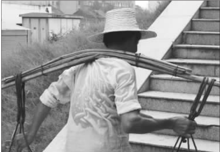
建筑工地的民工应向谁领高温津贴 资料图片

北京市人力资源和社会保障局相关负责人6日表示,随着全球气候变暖 and 极端天气的增多,劳动者在高温天气下工作更艰辛,劳动强度更大。北京市人保部门考虑到工资水平和物价等因素,决定昨日起上调劳动者高温津贴标准。据介绍,北京市室外露天作业人员高温津贴标