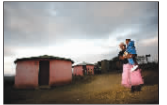
村妇抱着小孩在散步