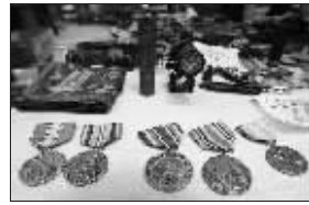
美军勋章在市场上也找得到