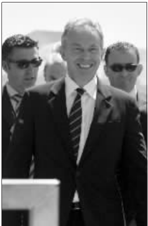
布莱尔(前)访问耶路撒冷伯利恒一检查站。