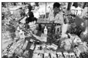
市场上,商人在售卖美国商品