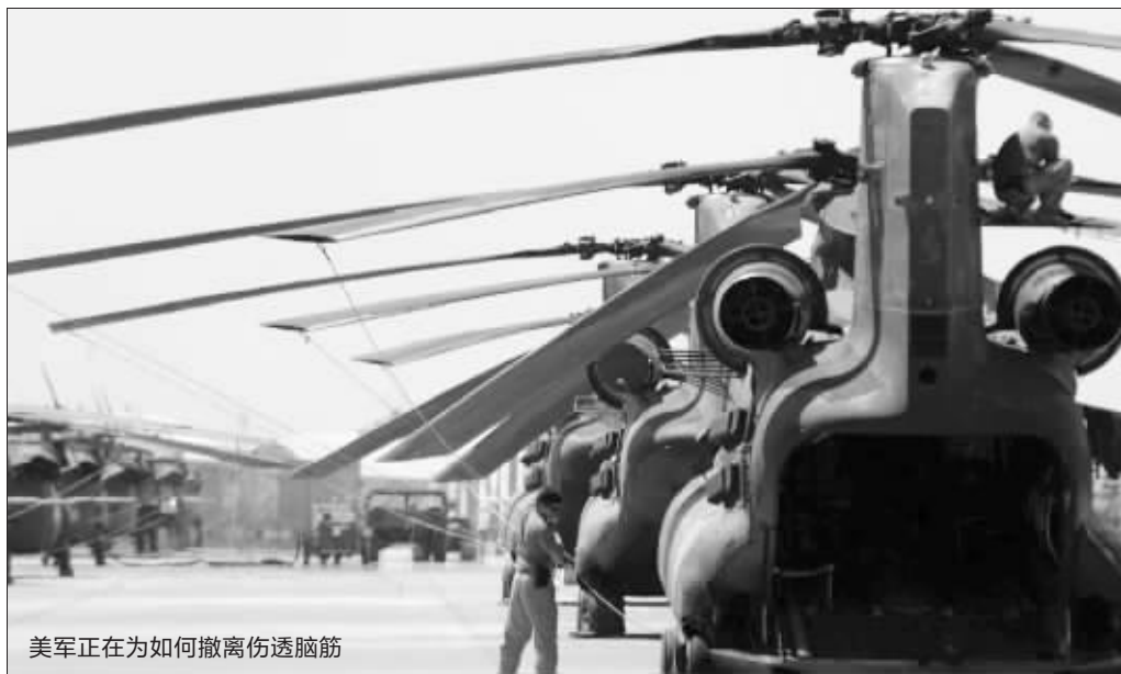
美军正在为如何撤离伤透脑筋