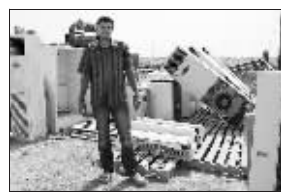
原美军基地的空调是畅销商品

我妻子就说她不喜欢待在这里面,因为有奇怪的感受。”他说,“当我们家来客人的时候,不到一个小时,客人们就会主动要求坐在外面,他们说,坐在集装箱房屋里会让他们有好像被美军抓住的感觉。” 据《信息时报》