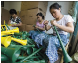
工人正制作瓦瓦祖拉

瓦瓦祖拉,这个把南非世界杯吵翻了天的喇叭,事实上均是“中国制造”。对那些工人来说,瓦瓦祖拉不过是为他们带来每小时6元钱收入的一份生计,瓦瓦祖拉制造的那些声音离他们的世界实在是太过遥远了。