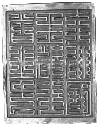
▲ 贵州安顺市曾发现的疑似建文帝流亡期间所铸印章