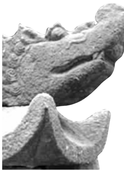
▲ 福建宁德古墓曾被论证为建文帝陵