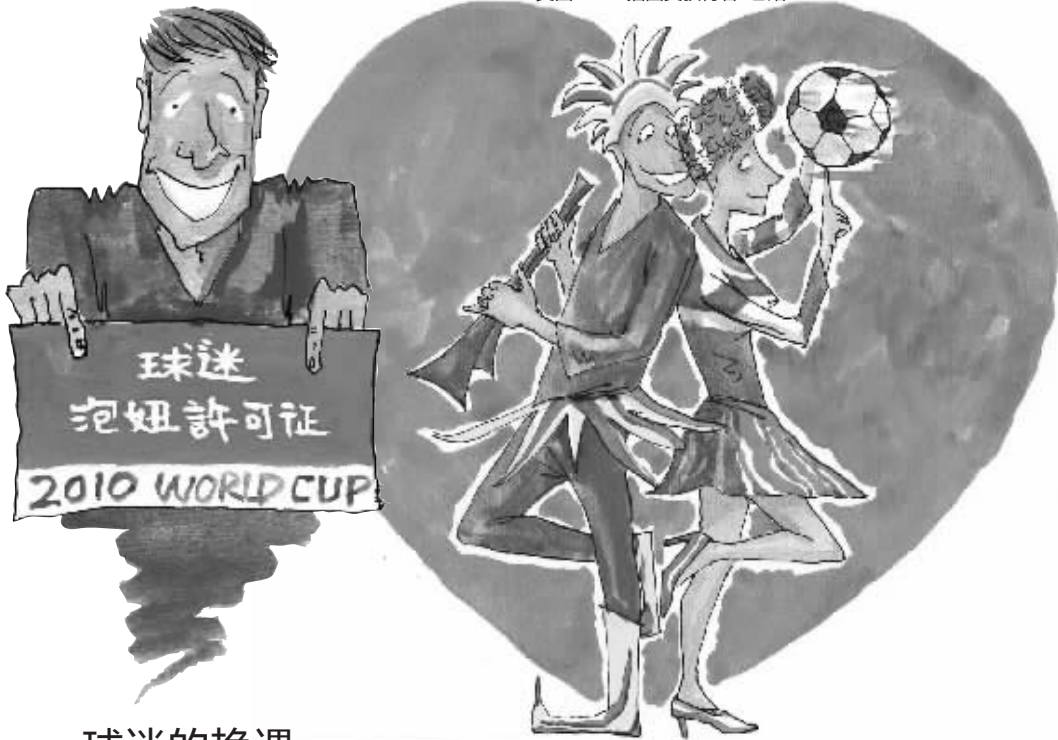
绘图/鲁嘉 插画师 美国 SND 插图奖获得者 已婚