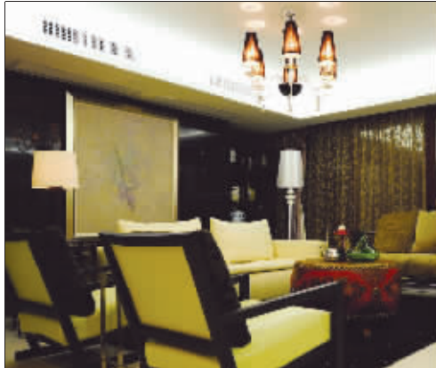
现代与传统和谐融洽的客厅