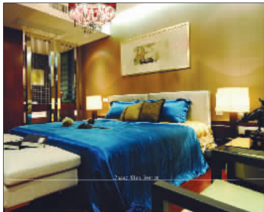
悬挂“青莲对月”的主人卧室

所幸,在这个闷热的季节,我们能够在莫愁湖畔的这套近300平方米的湖景住宅中感受到美妙的家居设计给我们带来的涤荡心灵的一丝清凉。