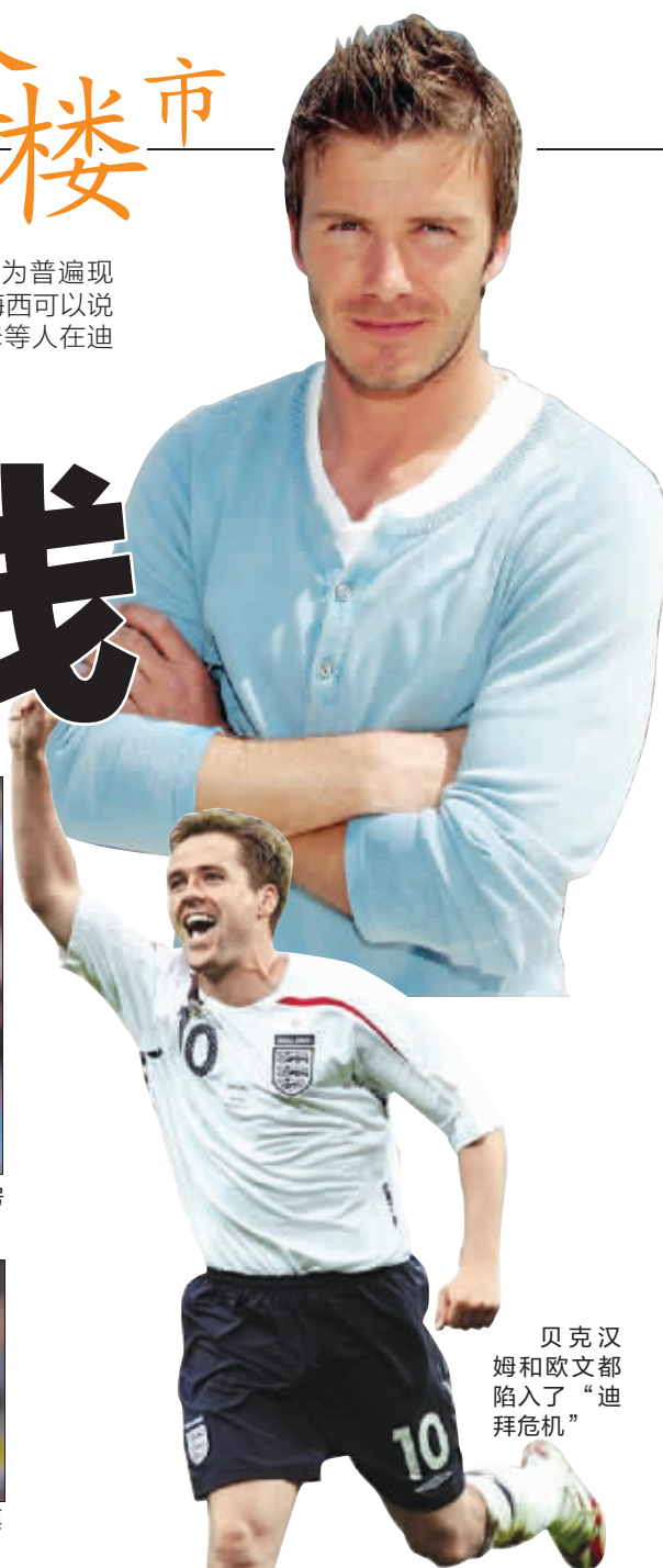
贝克汉姆和欧文都陷入了“迪拜危机”

当梅西在球场上尽情表演,疯狂进球时,他的老爸豪尔赫也在生意场上大展身手,疯狂捞金。前不久《法国足球》就公布了一项有关足坛收入排名的数据,据显示,在