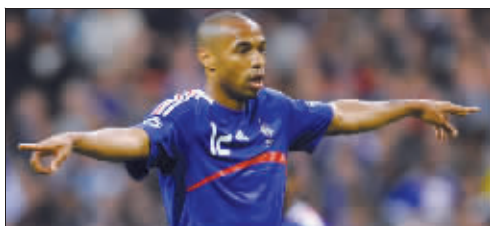
亨利通过房产赚了一票