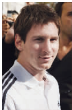
梅西负责赚钱,他老爸负责“钱生钱”

除了C罗,罗纳尔多、亨利等人也曾通过卖房子大赚一笔,他们卖房子的理由也很简单,“我在伦敦有很多套房产,我离开阿森纳之后,这些房子我住不过来了。”亨利说。