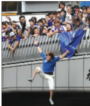
日本球迷跳桥欢庆