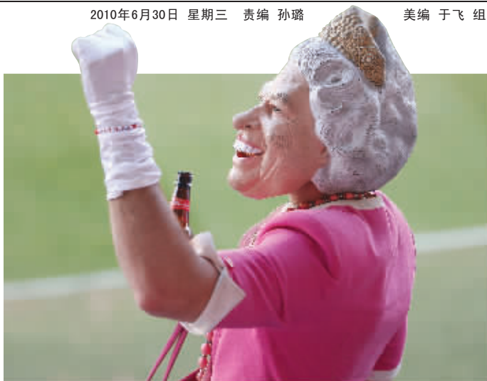
“英国女王”也爱看球喝酒