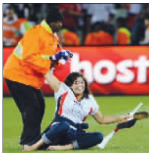
女同学,请注意形象