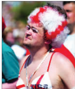
连球迷也流行扮伪娘