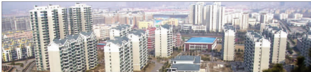
将军山上看商品房