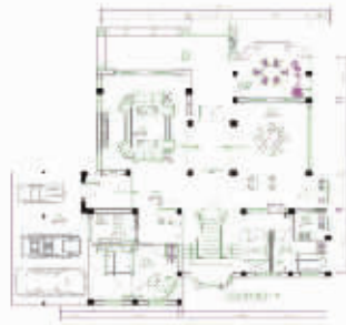
一层设计后平面布置图