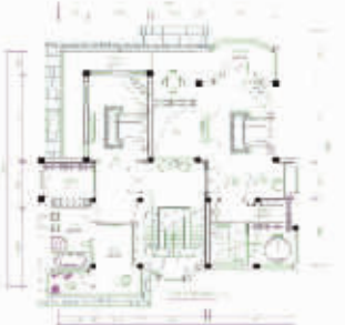
二层设计后平面布置图