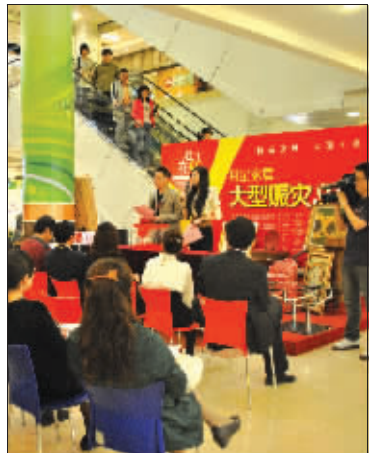
玉树地震后,月星家居举行大型赈灾义拍活动。