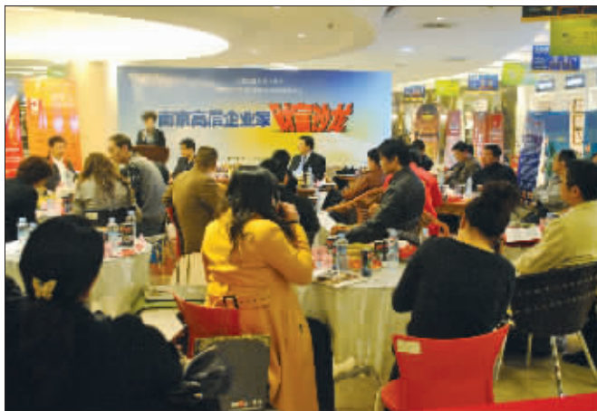
月星家居举办南京高层企业家财富沙龙,月星一直在提升中国人的居家文化品质上不断努力。