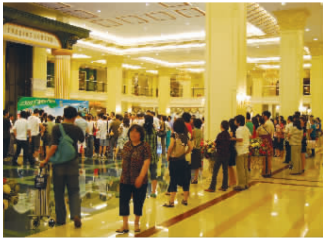
今年端午节,月星家居人气火爆。