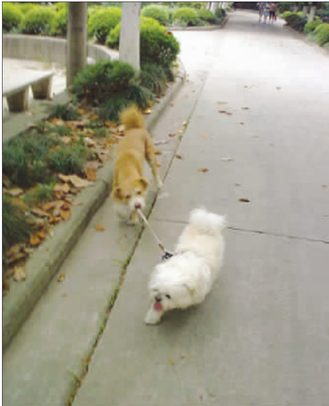
别跑别跑,万一跑丢了,我可负不起这个责任。(作者获30元话费)