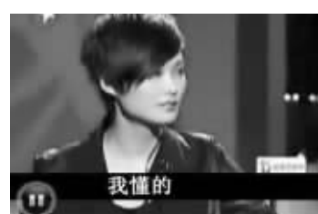
其实,信春哥不挂科,你懂的。