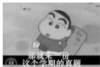
小新也来求真题了