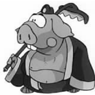
去西天,只为下载复习课件,不料U盘有毒被勒令打道回府……

那怎样才能确保占座率呢?视频制作者又图文并茂地向广大网友们呈现了两种特殊手段。首当其冲的就是美人计,只是一个不小心选错了人选,《食神》里的如花大姊挖着鼻孔向镜头前奔来:“帅哥,你的位子给我坐吧!”结果可想而知,吓得肩直