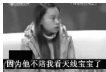
男友要去上自习,凤姐闹分手