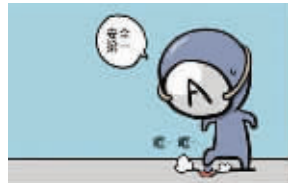
A型血的性格追求完美,在恋爱初期表现得特别小心