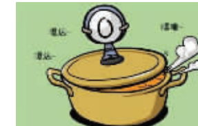
O型血像热锅一样容易沸腾,但对方拖延太久会马上冷掉