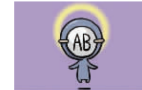
AB型血本性是善良的,该照顾爱人的时候会很照顾