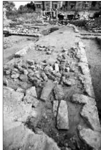
通济门城墙遗址发掘现场