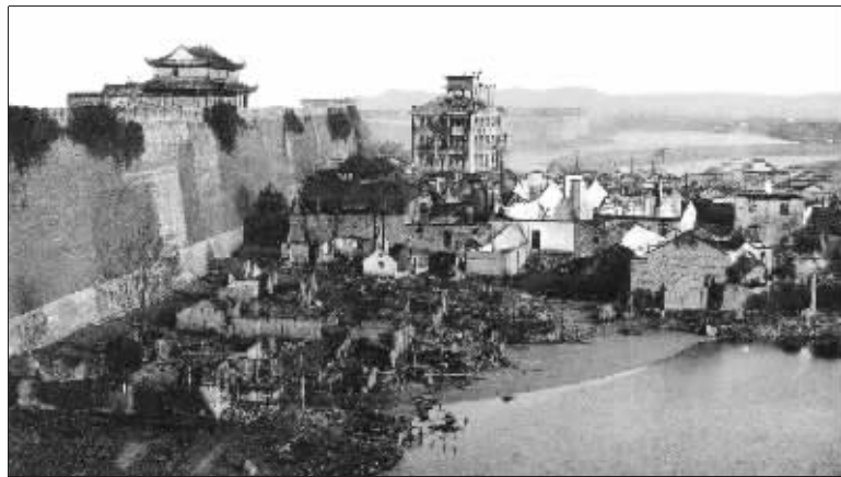
通济门外的景象