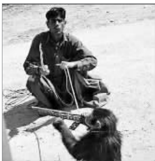
塔利班在训练“猴子士兵”,上图为电影《人猿星球》剧照