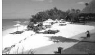
英国最高法院的大法官在旅游胜地边度假边办案

在旅游胜地一边度假一边工作?你可能会觉得这是天方夜谭,但世界上确实存在这种美差,它属于英国最高法院的大法官们。他们白天在当地政府大楼里举行听证会,晚上则在这些异国风情的岛屿上尽情享受。