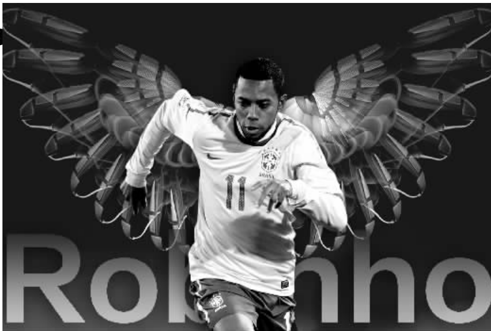
不踩几个单车,不一对一单挑,你想让他传球门都没有,罗比尼奥是一只向往自由的热带小鸟 制图 李荣荣

移动用户请编辑“902+用户留言”,发至10665566089。短信资费:1元/条