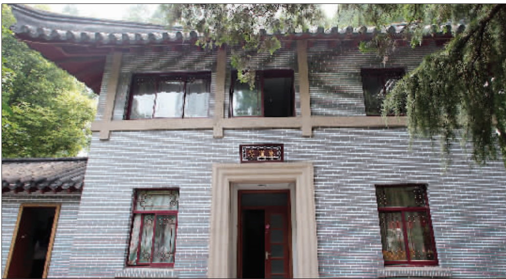
尊道楼原是教士们的生活区,现在改作老师们的办公区