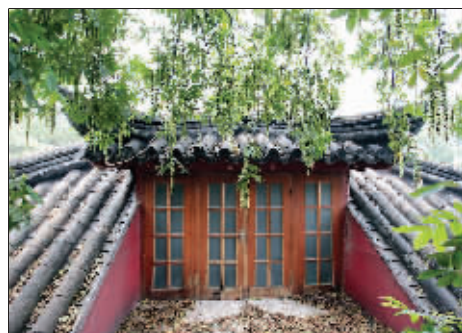
满地黄叶另有一番意境