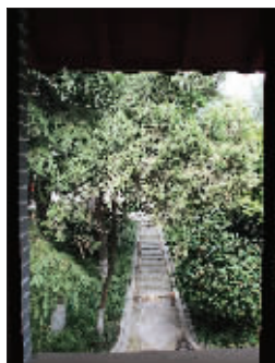
一墙之隔的绣球公园