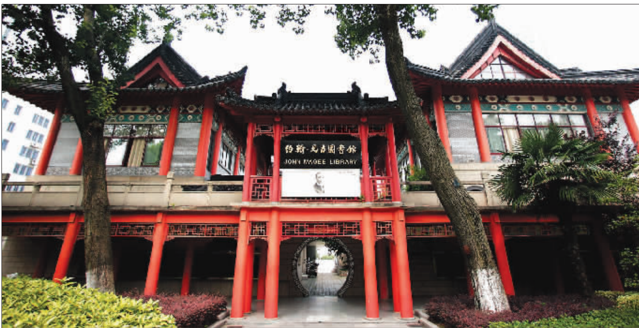
道胜堂的双楼,南楼是学生阅览室,北楼是教师阅览室